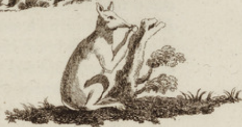
Agouti espece de Lievre

L' Ante que les Espagnols appellent la Grande Beste ) Et que quelques Voyageurs ont nomme Chyppatatame ou le Cheval Marin .