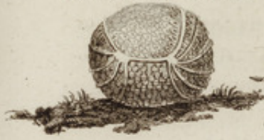
Le Tatou mis en boule