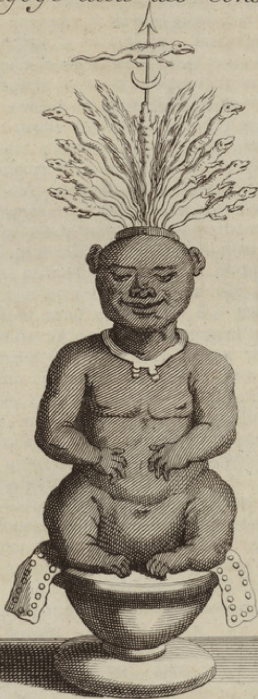
Echelle d'un Pied.